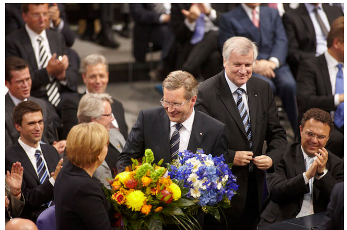
Bundeskanzlerin Angela Merkel gratuliert Christian Wulff zur Wahl zum Bundespräsidenten